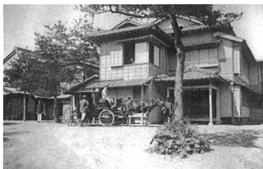
②旅館「観翠楼」