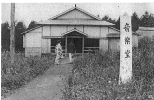
①千ヶ滝別荘地の音楽堂

箱根土地株式会社が「軽井沢千ヶ滝の文化村」開発を始めたのは、ちょうど100年前の1918年。本展示ではその生まれつつある千ヶ滝別荘地の生活を、写真資料を通じて、ご紹介します。人々が着物姿で馬車を走らせ、読書にスケッチ、歌唱を楽しみ、自然に囲まれながら文化的に過ごす。軽井沢の「静」の魅力、現代まで受け継がれる別荘生活のさまざまな場面をお楽しみ下さい。